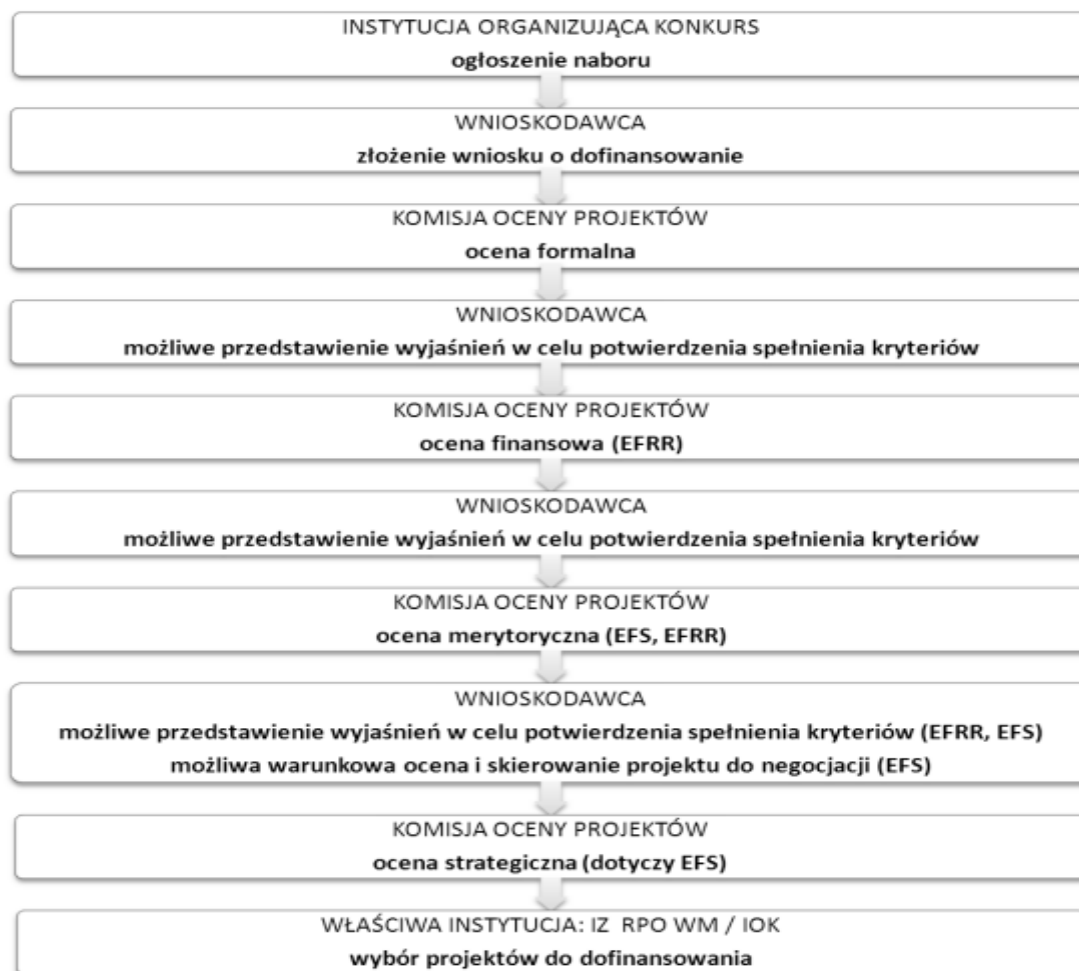
Schemat 1 Schemat wyboru projektów w trybie konkursowym RPO WM 2014-2020

Źródło: Szczegółowy Opis Osi Priorytetowych Regionalnego Programu Operacyjnego Województwa Małopolskiego na lata 2014-2020, Załącznik nr 1 do Uchwały Nr 62/16 Zarządu Województwa Małopolskiego z dnia 14 stycznia 2016 r. (Schemat 1, str. 8).